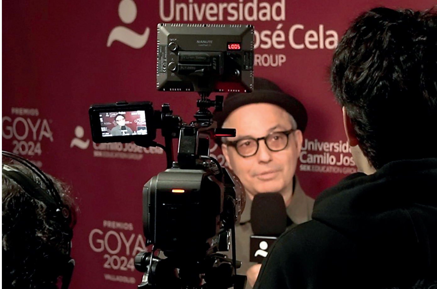
Pablo Berger. Ganador del Goya a la mejor película de animación y nominado al Óscar a la mejor película de animación. 2024