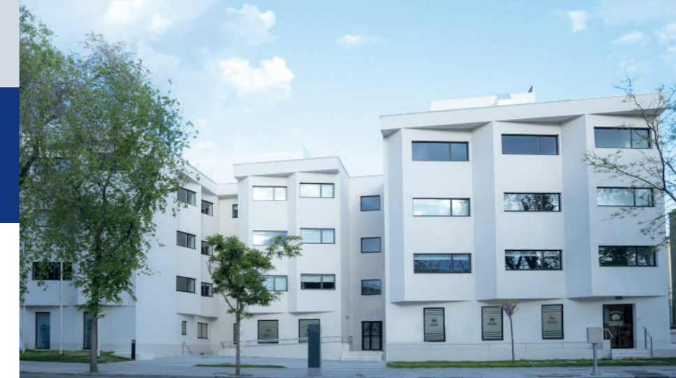
Sede de ISDE Madrid (C/ Serrano 208)

ISDE es la universidad de los bufetes y empresas