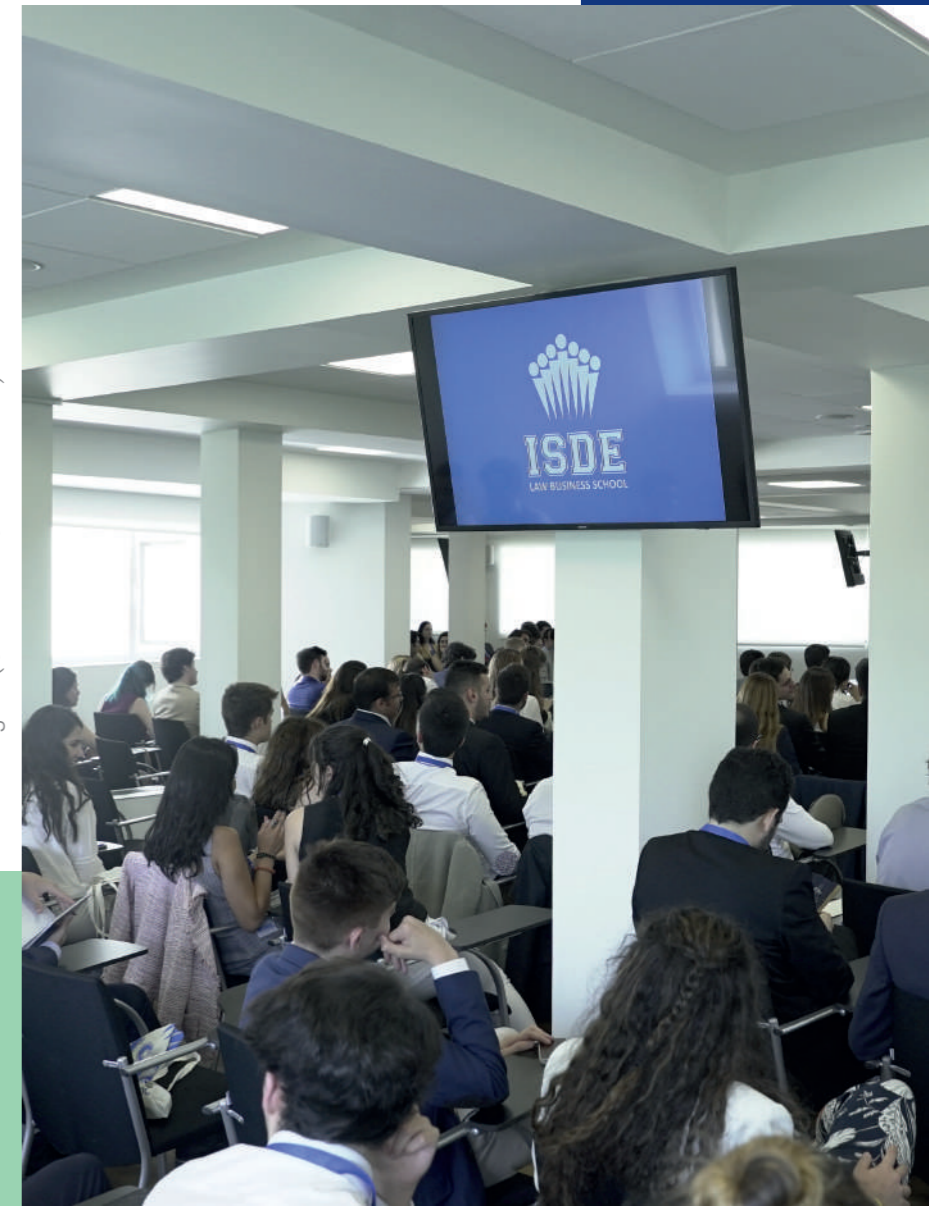
Aula Magna (Sede de ISDE Madrid)

De este modo, se ofrece a los estudiantes un esquema jurídico que, complementando a los contenidos académicos del Grado, les permite encauzar su vocación y desarrollar sus habilidades jurídicas con un marcado carácter diferenciador respecto del resto de programas de derecho que existen en el mercado.