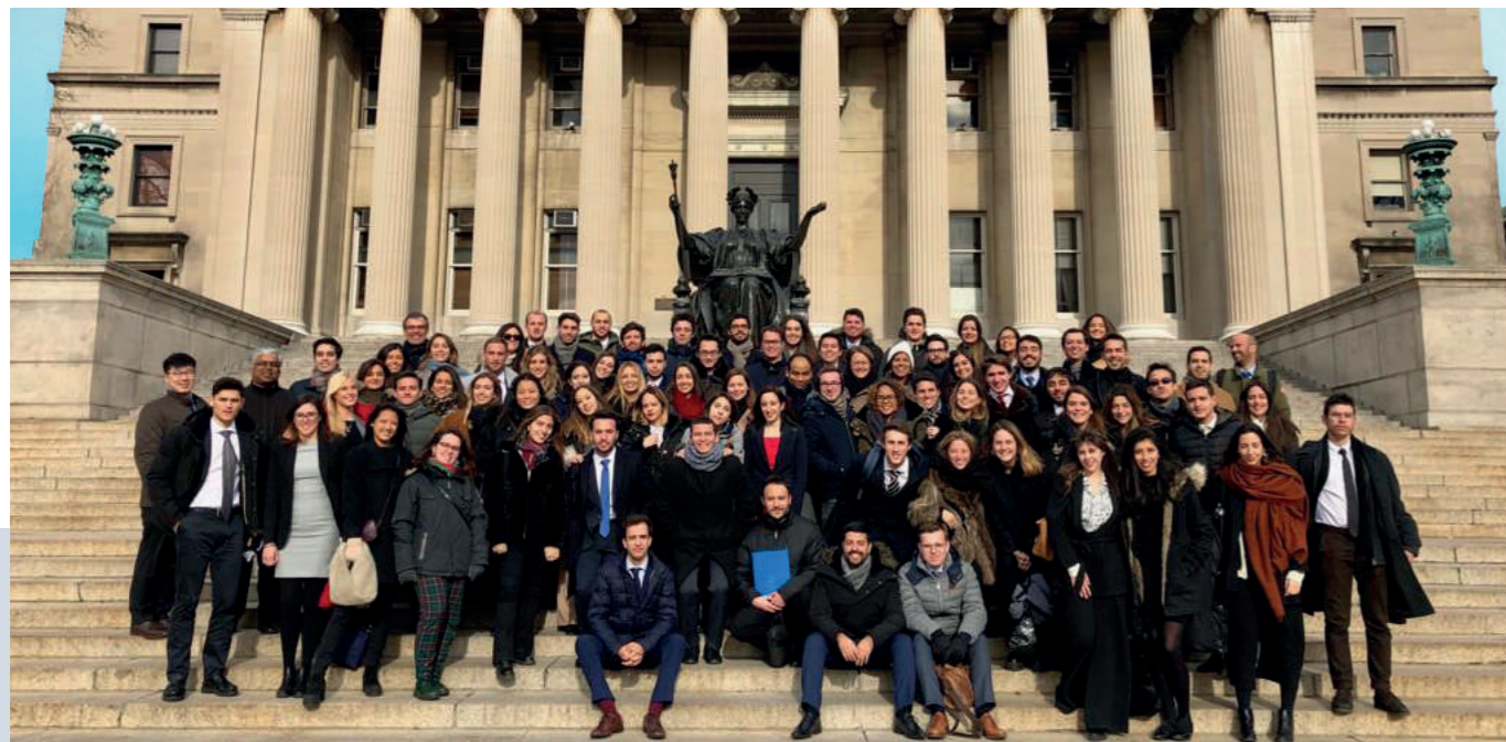
Alumnos en Universidad de Columbia (EEUU)

Lo anterior se complementa con un ambicioso plan de formación en el extranjero a través de estancias académicas internacionales que además podrían estar complementadas con integraciones reales en firmas internacionales.