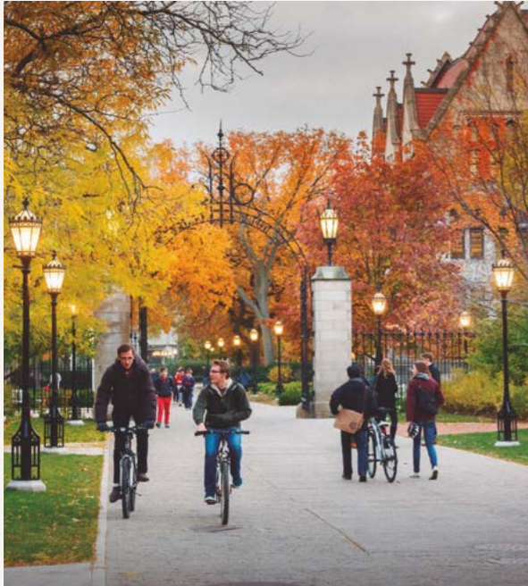
The University of Chicago