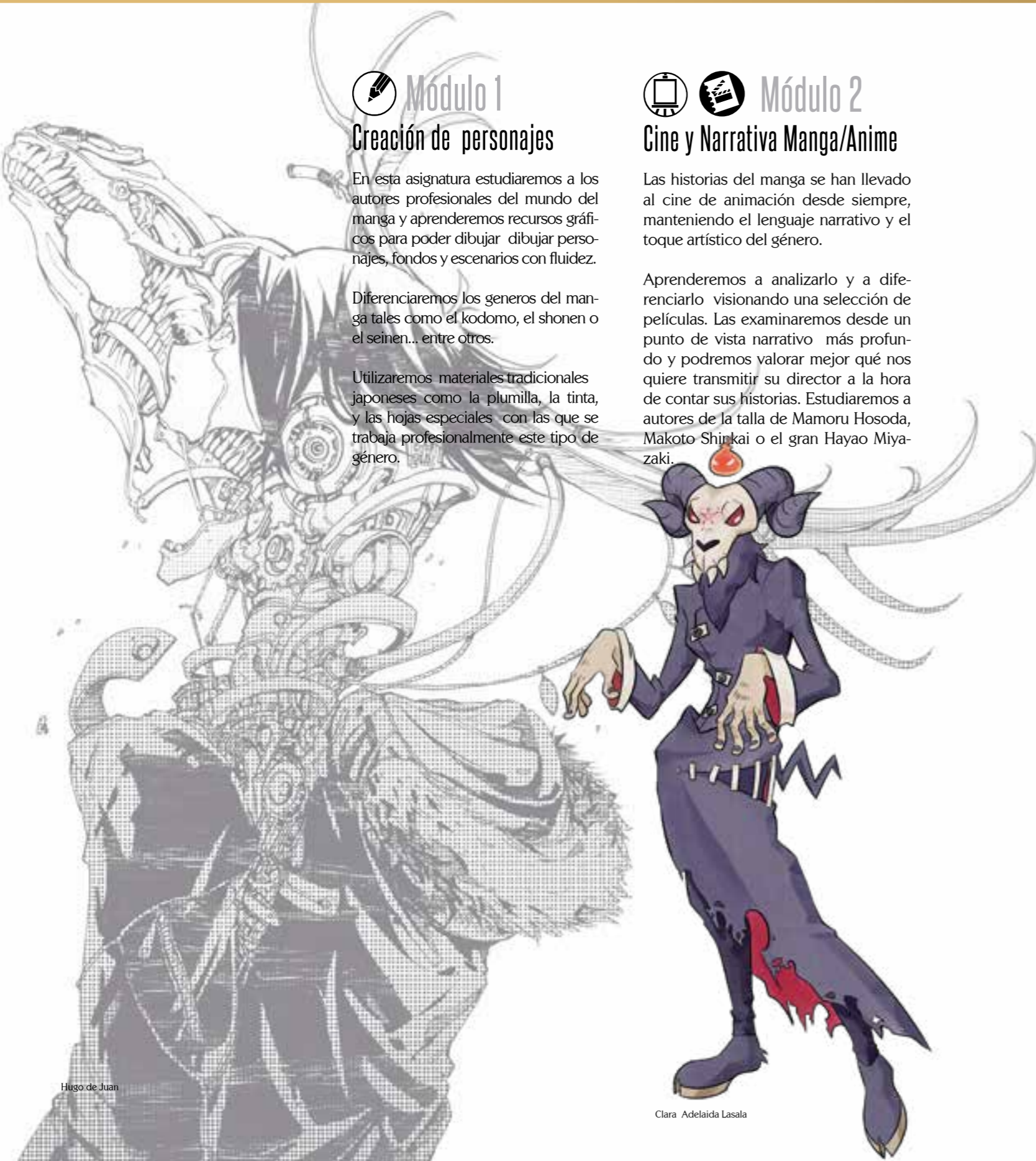
Hugo de Juan

Utilizaremos materiales tradicionales japoneses como la plumilla, la tinta, y las hojas especiales con las que se trabaja profesionalmente este tipo de género.