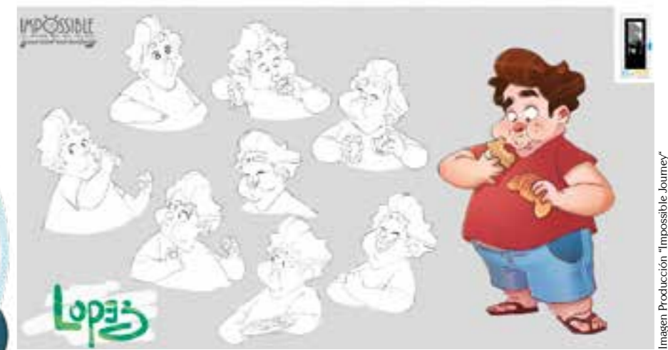
Imagen Producción "Impossible Journey"