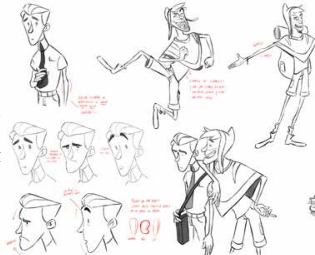
Imagen de producción del corto "I wish..."

Estos trabajos de los alumnos están alcanzando año tras año una calidad inusitada para un trabajo de escuela, compitiendo con los mejores trabajos profesionales de la especialidad y reconocidos con más de cien premios en los últimos años y cuatro nominaciones a los Premios Goya.